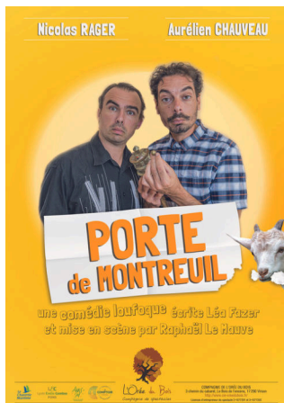
Porte de Montreuil (création 2018) Théâtre Tout Public