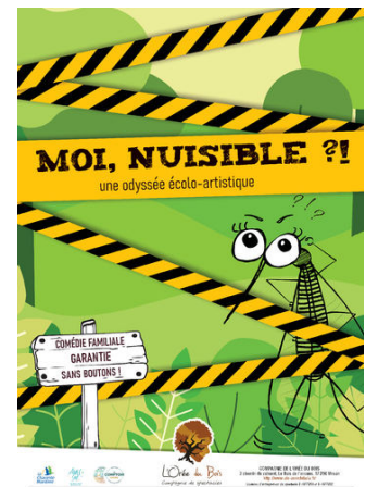
Moi, nuisible ?! (création 2023) Théâtre Jeune Public